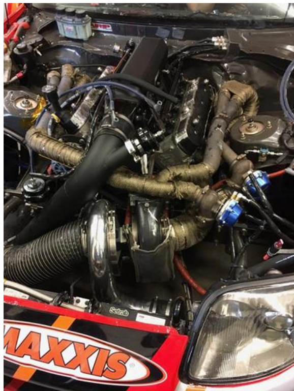
Overtake 1205 hk och 1300 NM i vridmoment

Nu ser vi fram mot ett jubileumsår då Sällskapet fyller 25 år i höst.