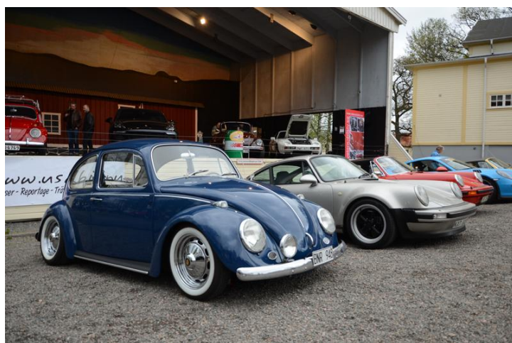
Onsdag i Parken 16/8