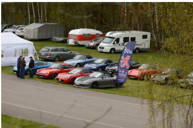
SSJ parkering Kinnekulle 13/5